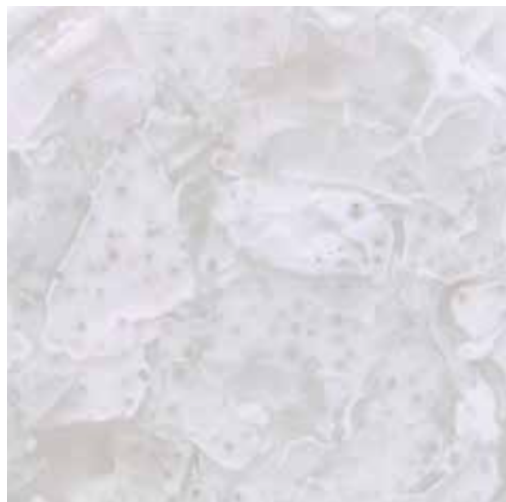
Opal Matt オパールマット CGC1478