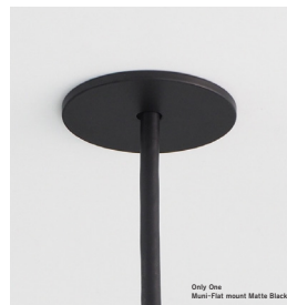
※画像のフラットフランジは、Onlyone muniシリーズ Fat mount