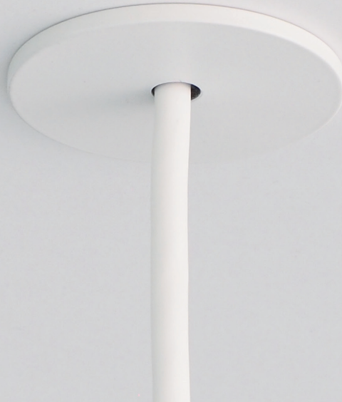
IMAGE : Only One Muni-Flat mount Matte White